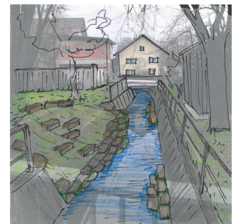
Situation in Buchhofen Ortsmitte Zugang zum Bach und ökologische Aufwertung Bach weiterhin mit Schleppnetz zu reinigen