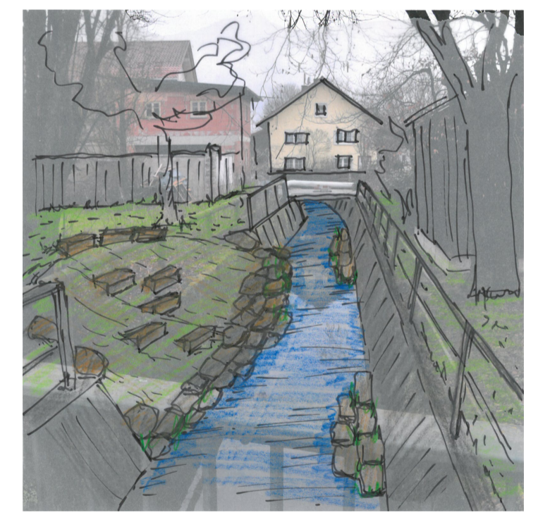
Situation in Buchhofen Ortsmitte Zugang zum Bach und ökologische Aufwertung Bach weiterhin mit Schleppnetz zu reinigen