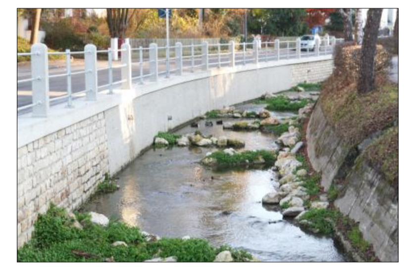
Gestaltungsbeispiel Roßbach in Landshut