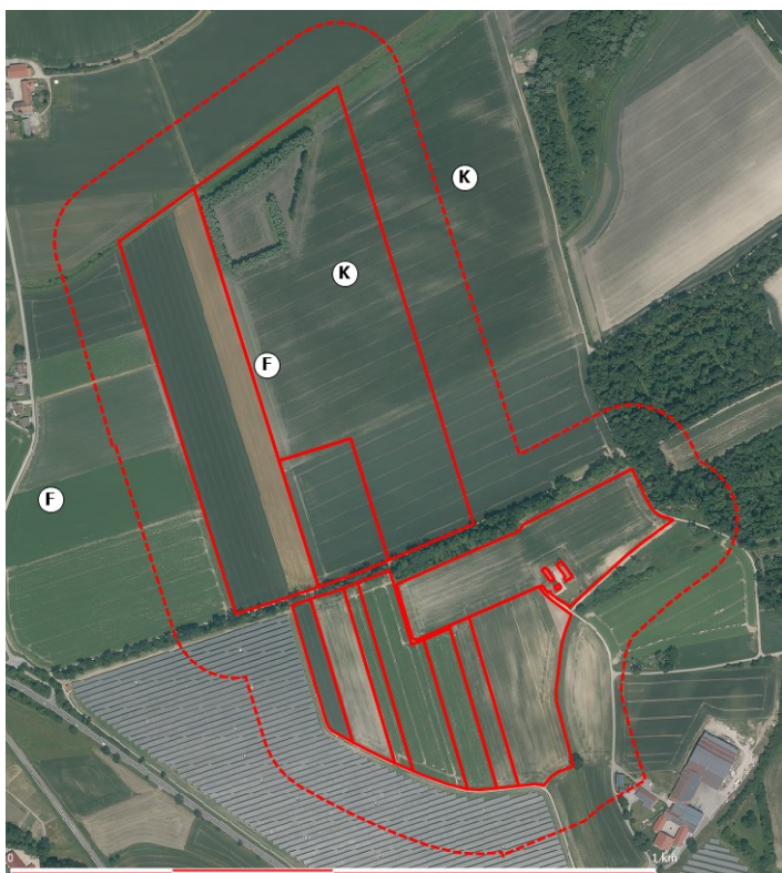
Abbildung 1: Lage der Revierzentren von Feldlerche (F) und Kiebitz (K), rote Linien: Flächen des geplanten Solarparks Burgstall West II, rot gestrichelt: 100-Meter Puffer, Hintergrund Quelle: https://geoportal.bayern.de/bayernatlas/ )