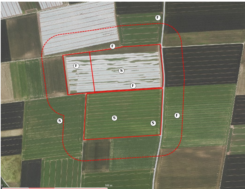
Abbildung 3: Lage der Revierzentren von Feldlerche (F) und Schafstelze (S), rote Linien: Flächen des geplanten Solarparks Langenisarhofen IV West, rot gestrichelt: 100-Meter Puffer, Hintergrund Quelle: https://geoportal.bayern.de/bayernatlas/ )